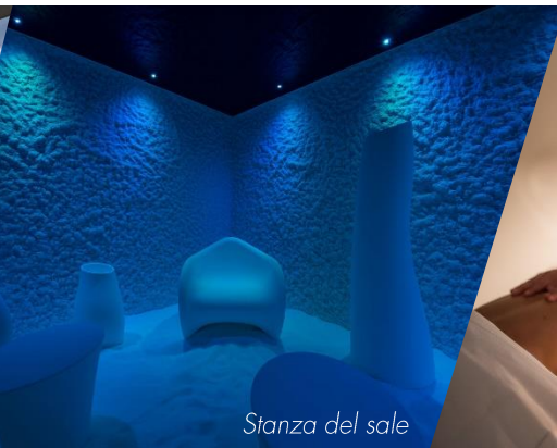
Stanza del sale