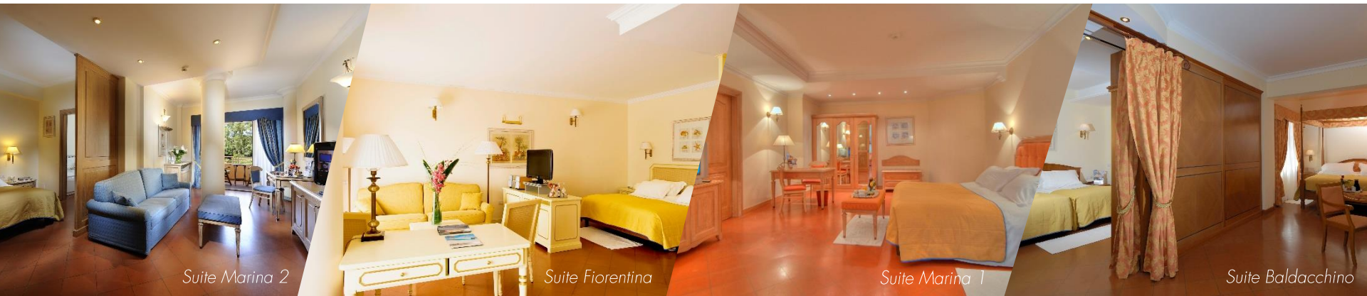
Suite Marina 2