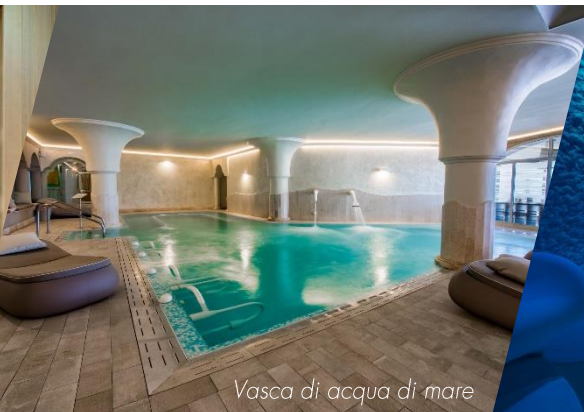
Vasca di acqua di mare